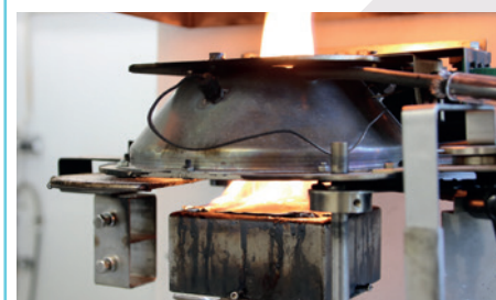
Essai au cône calorimètre

Trois centres menant une recherche de pointe pour et avec les entreprises.