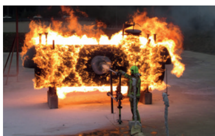
Essai de feu de torche de propane au GESIP