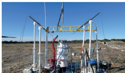
Prototype d'étude du BLEVE d'eau (300°C; 85 bar)