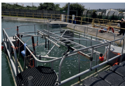
Essais de BLOW OUT de gaz naturel

Le risque d'explosion de l'enceinte pressurisée et les effets d'onde de surpression en champ proche ont été caractérisés.