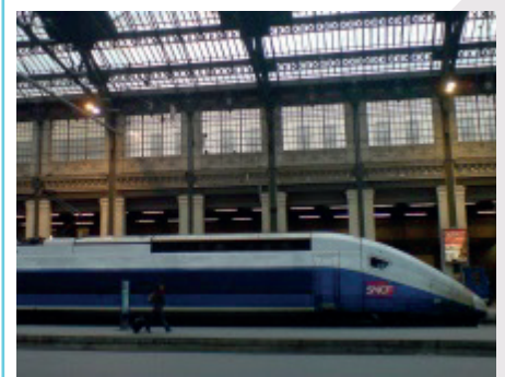
Exemples de Systèmes Complexes

Trois centres menant une recherche de pointe pour et avec les entreprises.